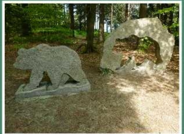
ältester und guterhaltener Bärenfang der Welt