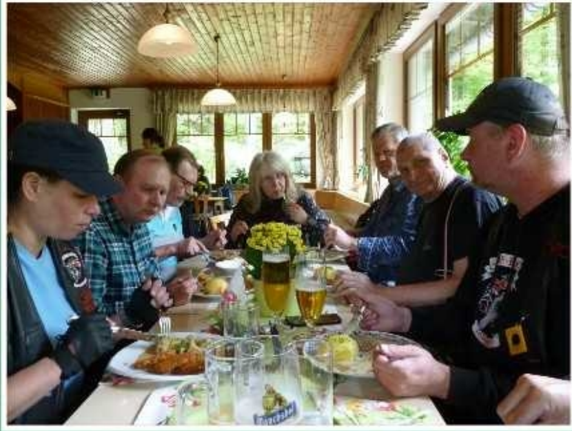
Essen und gemütliches Beisammensein im Waldsteinhaus